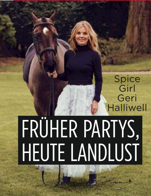
Spice Girl Geri Halliwell

EXKLUSIV NINO DE ANGELO »ICH BIN FROH, WENN ICH IN FÜNF JAHREN NOCH LEBE«